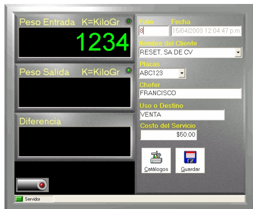
Vista del Módulo de Captura

Cuenta con: vista tipo instrumento, fácil de usar, información segura y poderosa, reportes totalmente multiusuario.